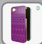
Retro Chic designs