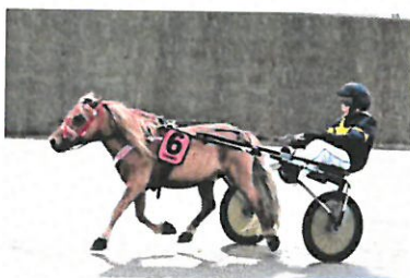
Bilder fra ponnitravløpet på Momarken Travbane 6.oktober 2020