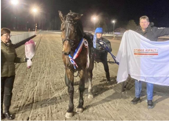
Vinneren av Carl Wollebæks minneløp.