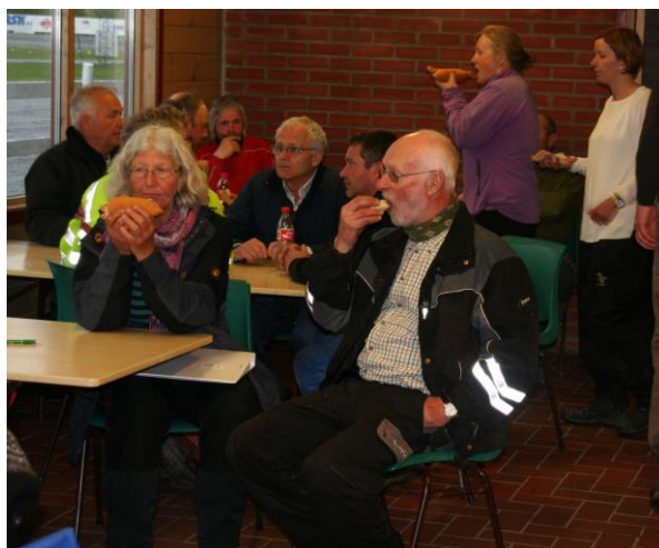
Bespising i vekta