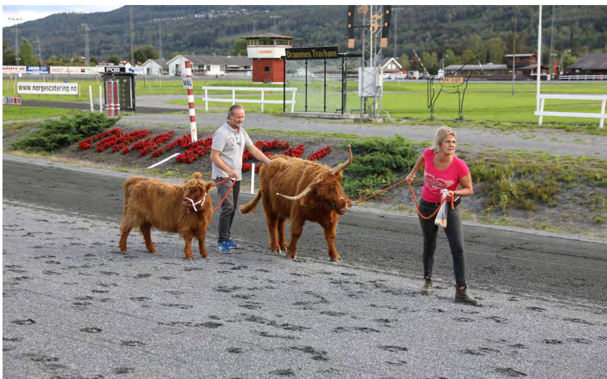
og Høylandsku m/kalv.