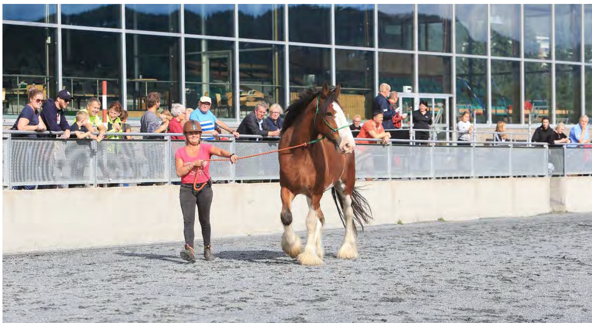
«Hanne høne» fra Veikåker stilte i raseparaden med både Clydesdalehest.....

Arrangementet var meget vellykket med mange besøkende som kunne gå fra post til post med ulike temaer rundt hesten. I løpsbanen ble det servert sprang- og dressuroppvisning, galoppløp og raseparade. Publikum kunne også få sitte på med store- og små hester, eller prøve seg i tandem-sulky.