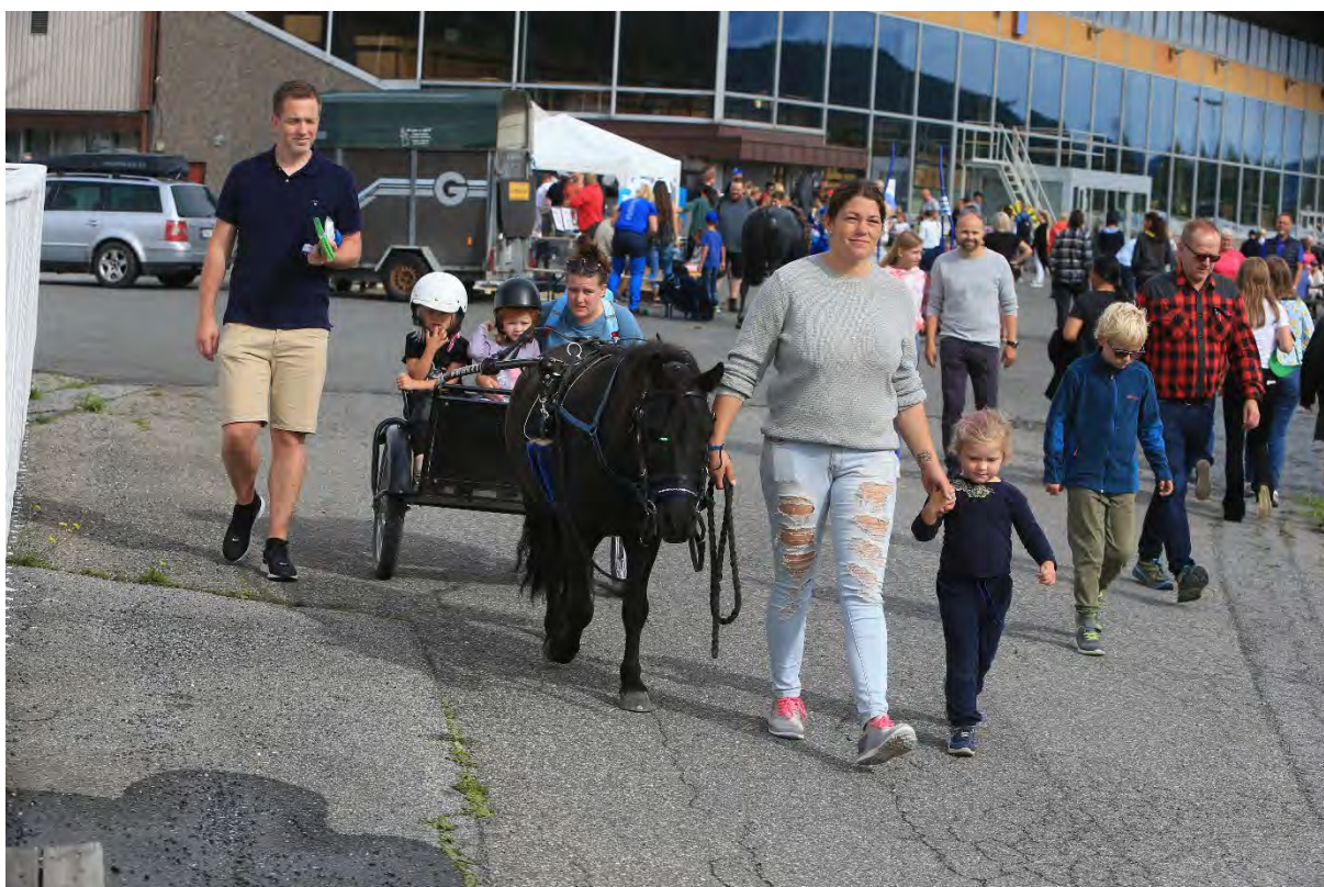
Øvre Eiker Travselskap hadde stand med kaniner og ponnier for både kos, ridning og kjøring.