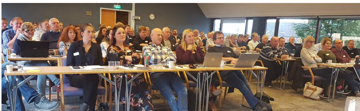
Fra Buskerud- Vestfold og Telemark Travforbunds felles høstkonferanse i 2019

Dagen ble avsluttet ved at de tre tilstedeværende forbundslederne fortalte litt fra sitt forbund og de aktivitetene som der foregår.