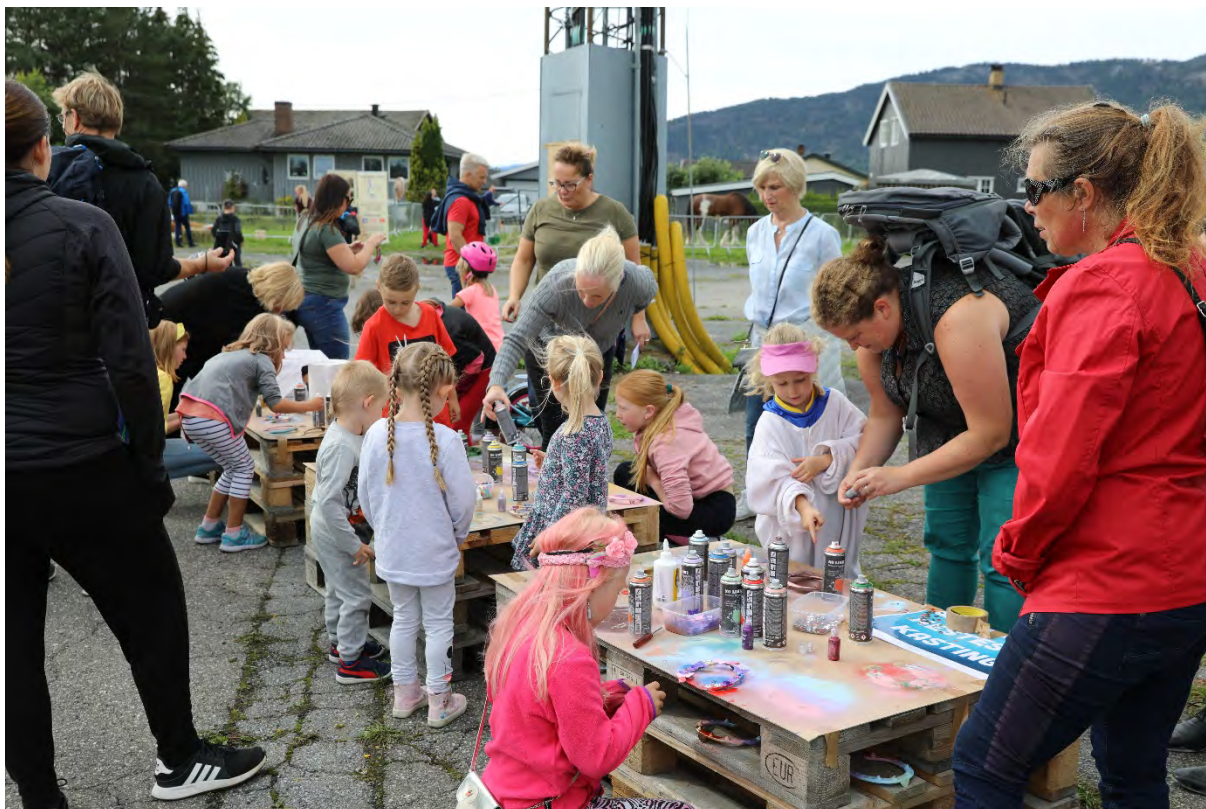
Krødsherad og Sigdal Travlag hadde stand med hesteskokasting etterfulgt av dekorering etter eget ønske, noe som falt i smak for de aller fleste.