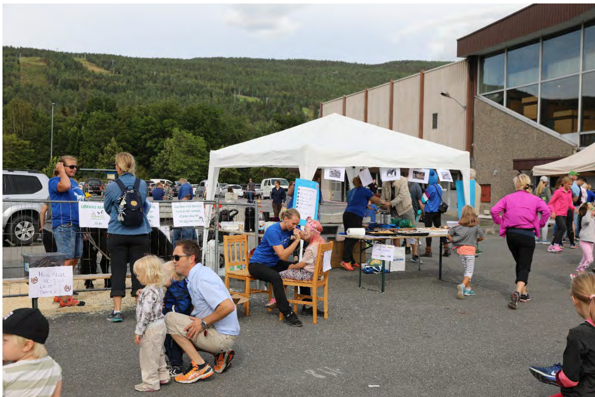
Simoa Travselskap hadde stand med aniktsmaling, koseponni og mange konkurranser.