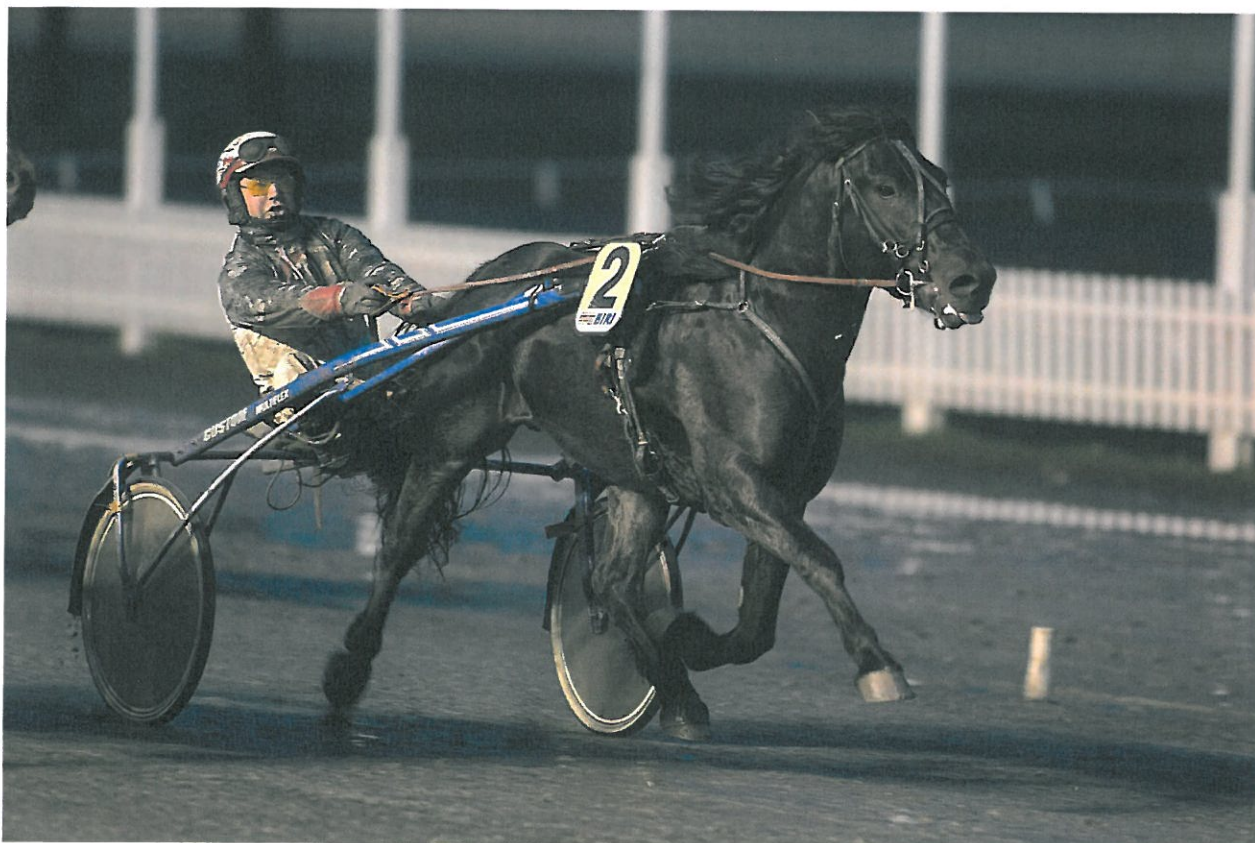
Birkeland-eide Steinfaks vinner Biri Oppdretningsløp 2014.