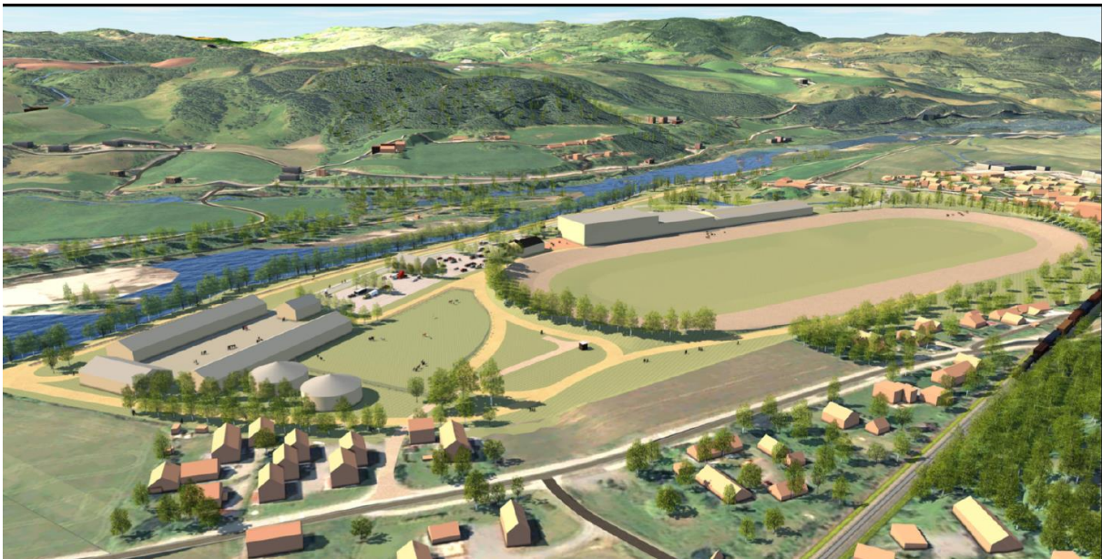
Figur 1 3D Modell

Planforslaget bygger på innholdet som var tiltenkt ny bane før vi valgte sted. Planforslaget som ligger ved, er nå tilpasset tomten på Fannrem. Konseptet er justert etter innspill fra ressursgruppe, infomøter og møte med travtrenerforeningen. Blant annet er banelengde justert til 1100m, racingstall og restaurant er blitt til ett bygg.