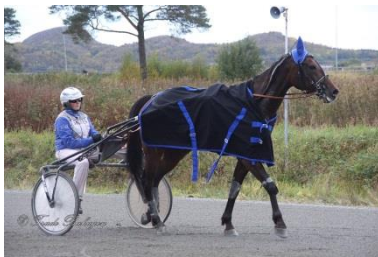
Vinner løp 7, Yesyesyes