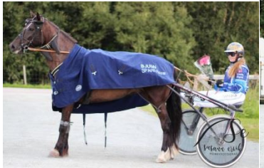
Vinner løp 4, Oria