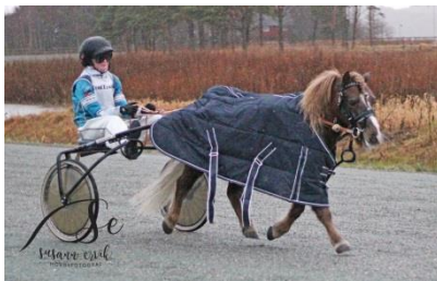
Vinner ponniløp 1, Sjøbrisens Dunder