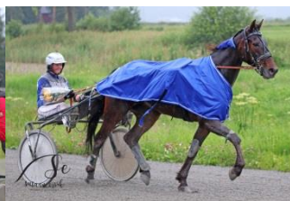
Vinner løp 8, Yesyesyes