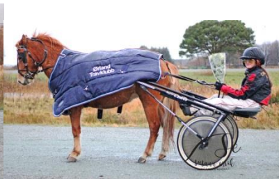
Vinner ponniløp 2, Trolldalens Iruss