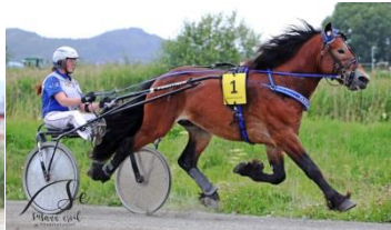
Vinner løp 3, Farsklars