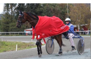
Vinner løp 5, Arc Ici