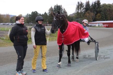
Vinner løp 6, Dalebros Vilja