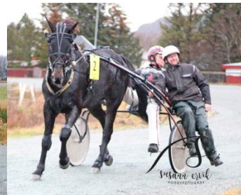
Vinner løp 1, Magic Messi