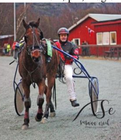
Vinner løp 4, With A Mission