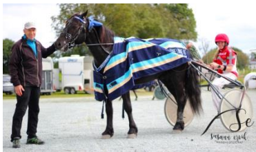
Vinner løp 1, Gutvotten