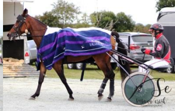
Vinner løp 2, Brilliant Star