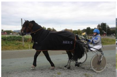
Vinner løp 4, Farsklars