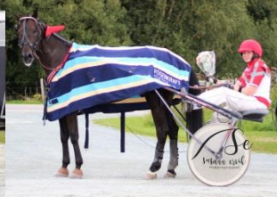
Vinner løp 3, Watch Me Defeatyou