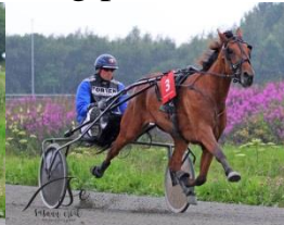
Vinner løp 5, Let Me Go