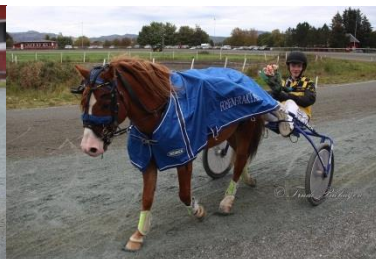
Vinner ponniløp 2, Ztenmark