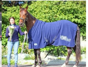
Vinner løp 8, Come Easy