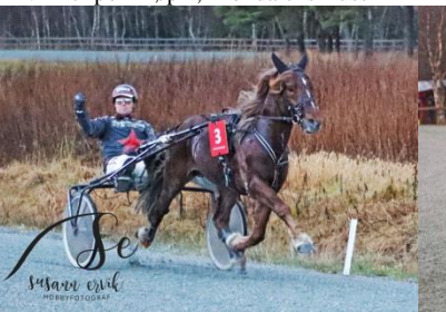
Vinner løp 3, Vestpol Lodin