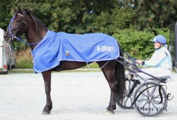
Vinner løp 6, Stavholt Edel