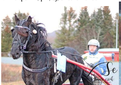
Vinner løp 2, Tverdals Trippel