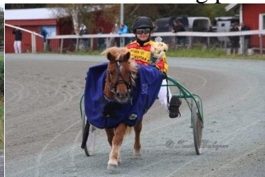
Vinner ponniløp 1, Maestro av Olafsbråten