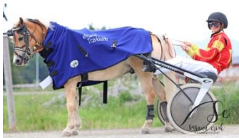
Vinner ponniløp 2, Pejnarve Tornado

Det var totalt 33 hester og ponnier til start.