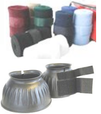
Eksempel på busser med borrelås