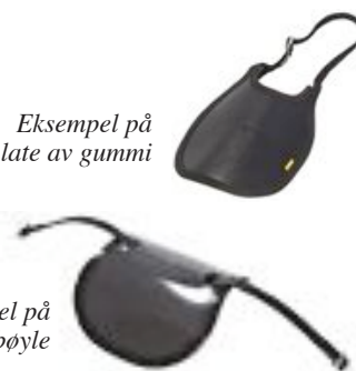
Eksempel på skitplate av gummi