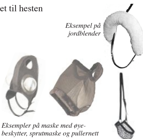
Eksempler på maske med øye-beskytter, sprutmaske og pullernett

Mekaniske anordninger for utvidelse av luftvegene på hesten er ikke tillatt.