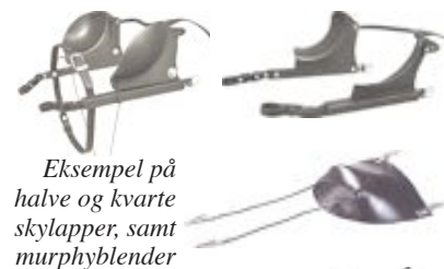
Eksempel på halve og kvarte skylapper, samt murphyblender

Skylapper, faste eller draskylapper, murphyblender eller “can’t see back” kan brukes, men skal monteres slik at hesten har syn på begge øynene etter oppsjekking. Det er ikke tillatt å stenge synet på ett øye på hest som har syn på begge øynene. Det er ikke tillatt med bruk av reflekterende materialer på innsiden av skylapper/murphyblender.