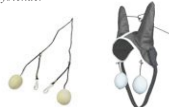
Eksempel på ørepropper og ørehette med propper

Bomull i ørene, ørepropper eller ørehette kan brukes enkeltvis eller i kombinasjon for å begrense hestens hørsel, men det tillates ikke å stenge helt for hestens hørsel. Det kan brukes faste ørepropper eller drapropper, likeså fast ørehette eller dra-ørehette. Gummipropper i ørehette tillates.