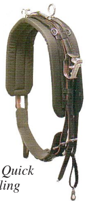
Sele med Quick Hitchkobling

Quick Hitch-kobling skal alltid være utstyrt med sikkerhetsreim.