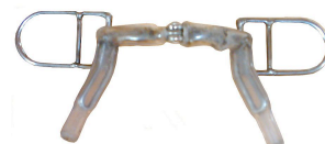
Extibitt kledd med gummi

Et Persson-bitt/Järvsöfaks-bitt/Exti-bitt kan være kledd med lær, gummi eller plast, men skal ha stålkjerne eller sikkerhetslenke. De to munndelene skal være like lange og like brede.