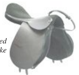
Sal med ryggstykke

Montérytter skal alltid ha sikkerhetsstigbøyler. Ved all ridning innenfor banens område skal montérytter ha fastspent hjelm og sikkerhetsvest.