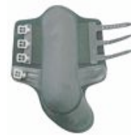
Eksempel på bakbeinsbelegg og bandasjer