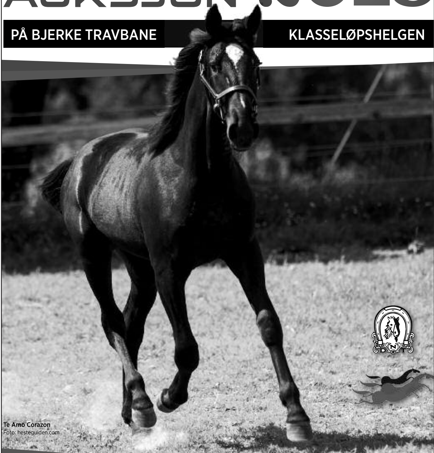
Te Amo Corazon