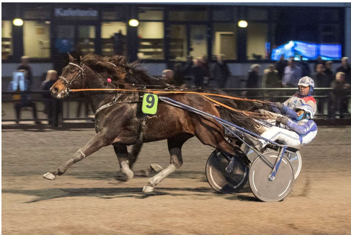
Hickothepooh og Vidar Hop vant Th Martinsens æreløp på Jarlsberg 31.oktober.