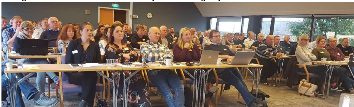
Fra Buskerud- Vestfold og Telemark Travforbunds felles høstkonferanse i 2019

Høstkonferansen 2020 skulle arrangeres for Vestfold, Buskerud og Telemark Travforbund – slik som tidligere år. Vestfold stod som arrangør, og det ble lagt ned mye jobb for å skape egasjement og motivere folk til å melde seg på. Det lyktes de med og hadde rekordstor påmelding med godt over 100 påmeldte. Til tross for tett samarbeid mellom VT, hotellet, DNT og kommuneoverlegen, så lyktes det dessverre ikke å lage en ramme rundt arrangementet som tilfredstilte de nasjonale retningslinjene.