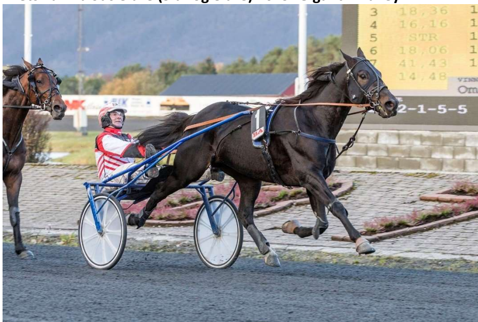
Gigant Invalley.

Eier Truls Desserud, Krødsherad og Sigdal Travlag. 9 år - 14 starter – 8 seire – 2 tredjeplasser – rekord 11,3a – innkjørt kr. 994.974. Etablerte seg i eliten og vant fire store løp i 2019. Klosterskogen Grand Prix, Bjerke Cup, Kniksens Æresløp i Bergen og Big Noons Pokalløp på Bjerke.