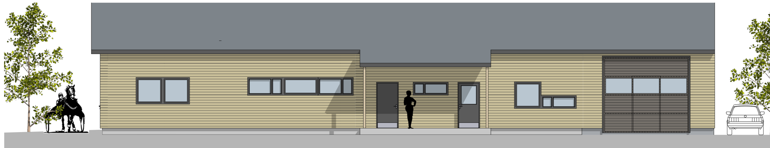
1:100 Fasade Sør