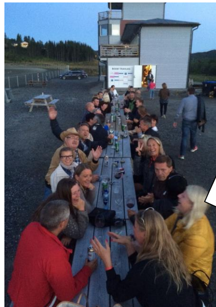
Bodø er kjent for bra Travfester! her fra langbord under august kjøringen for 2 år siden