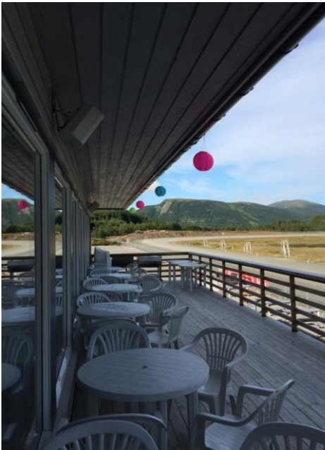
Stor terrasse med god utsikt i publikumsbygget