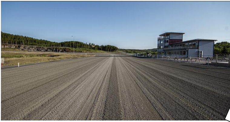
Bodø har en av Norges mest moderne og beste ovaler, nytt publikumsbygg med kafe/øl-vin salg og totalisatorspill