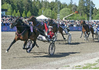
• Mosaïque Face.

Landet runt Åby Sid 75 ● Årjäng Sid 76 ● Östersund Sid 77 ● Romme Sid 78 ● Solvalla Sid 79