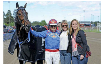
• Diamond Of Em.

– Enormt skönt. Loppet blev jättebra för hennes del, men jag vill ändå säga att hon inte håller toppform. Med det här loppet i kroppen kommer hon att gå framåt rejält, sade Croon, som har full snurr på materialet i stallet. Kvällen innan segrade hans Define'Em och det är de båda EM Stables-uppfödda hästarna som tagit Croons samtliga årssegrar 2015.