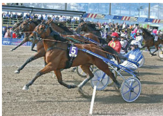
• Tango Lavec.