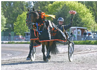
• Tangen Haap.