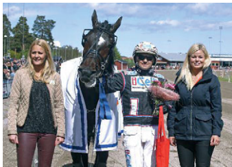
• Shadow Woodland.