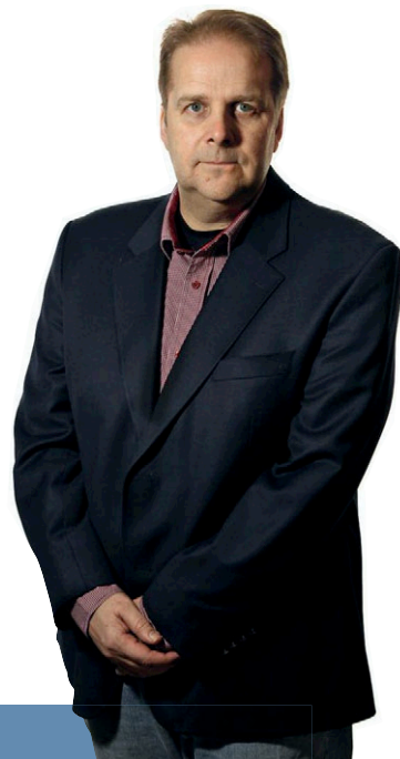
OLA LERNÅ STOCKHOLM

Över sprinterdistans (eller över alla distanser under 3 000 meter i mina ögon) slår Månprinsen A.M. ur underläge, men för första gången på länge känns Elitkampen som ett av helgens verkliga toppnummer. Hur snabbt kan den här trion springa? Kan rent av Järvsö-faks fullständigt osannolika 1.17,9 vara i farozonen?