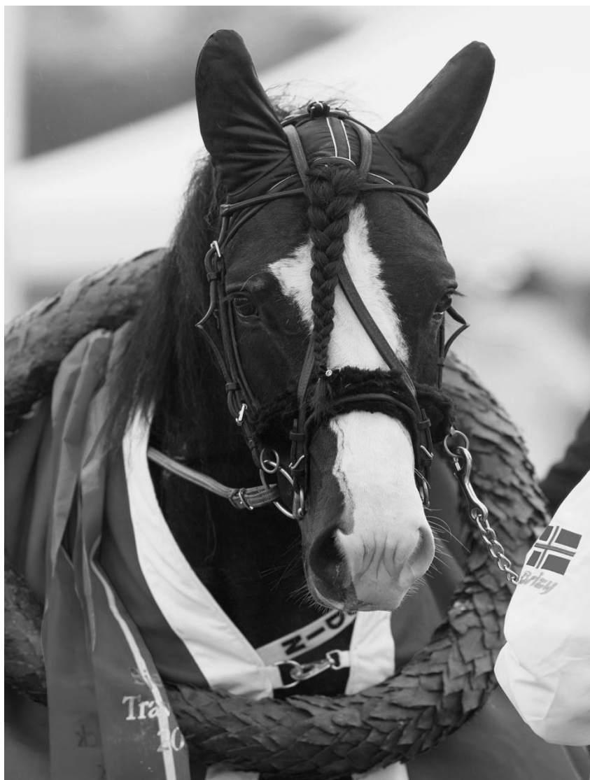
Vinner av Norsk Travkriterium 2011 – Tekno Odin